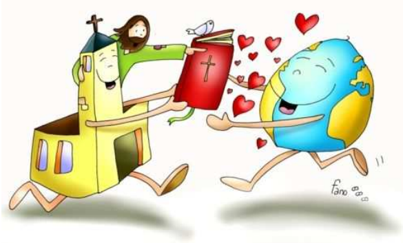
Regal, M. “Xesús, aquel home de aldea”

Agora e sempre, pase o que pase, conta con nós.