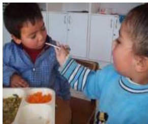
Imaxe 309 de nenos compartindo

Credes en Xesús Cristo, o seu fillo benquerido, sempre atento para dar unha man, e que nos quere dando vida á Pascua co noso bo facer de cada día?