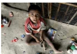
Imaxe 213 neno encadeado

Naqueles días, o Señor díxolle a Moisés: