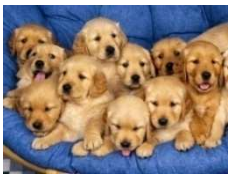
Imaxe 207 canciños

Cantas son Señor todas as túas obras. Todas feitas con gran saber. A terra está chea das túas criaturas.