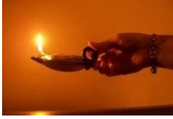
Imaxe 105 vela pequena (ao comezar as primeiras veliñas no cirio)