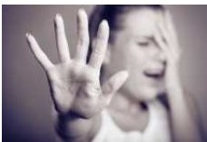
Imaxe 305 ameazar

* Renunciades a creros superiores aos outros; isto é: a calquera clase de abuso, discriminación, orgullo, egoísmo e desprezo?