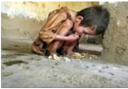
Imaxe 307 do neno famélico

* Renunciades aos criterios e comportamentos que fan do diñeiro a aspiración máis grande da vida, que poñen o pracer por enriba de todo, e que aprecian a liberdade persoal e o individualismo por enriba da responsabilidade social e da comunidade?