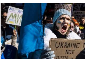
Imaxe 306 Ucrania

* Renunciades a calar diante das inxustizas e as necesidades das persoas e dos pobos, por covardía, preguiza, comodidade e vantaxes persoais?