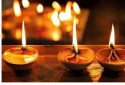
Imaxe 106 varias velas pequenas (ao empezar a pasar velas á xente)