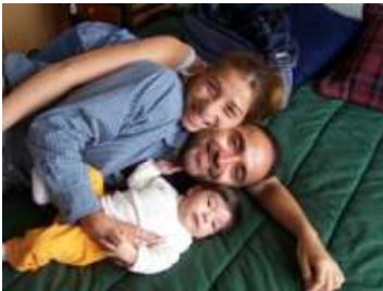
Imaxe 308 duns pais con cativa

Credes en Deus, Pai e Nai de todos os homes e mulleres, que nos agarima nas súas mans e que conta con nós para mellorar a vida?