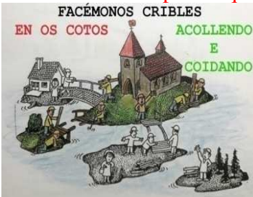
Imaxe 311 mellor pontes que muros

Credes na Igrexa, unha Igrexa que se fai crible en comunidade, acolledora, respectuosa e coidadora da terra e da vida de todas as mulleres e homes que non contan para ninguén?