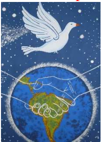
Imaxe 310 paz

Credes no Espírito de Deus, que nos alenta esperanza para soñar irmandade, que nos alenta forza para doernos coa violencia, que nos alenta paz para sementala por toda a Terra?