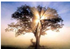
Imaxe 206 árbores

Cantas son Señor todas as túas obras. Todas feitas con gran saber. A terra está chea das túas criaturas.